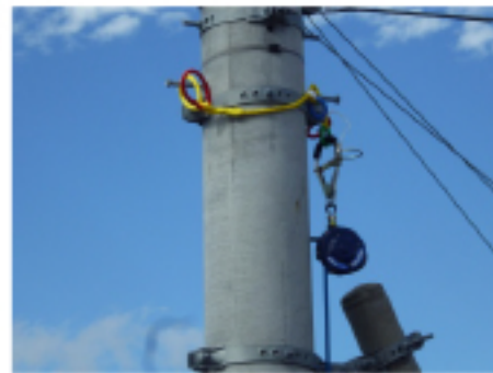
共架柱にロープを掛けた例