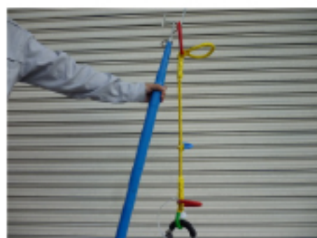
赤色のリングを操作棒に装着