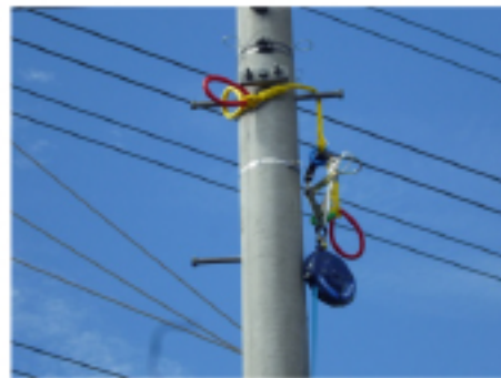
単独柱にロープを掛けた例